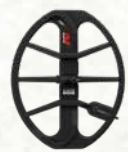
EQX 15 smartspoel

15 x 12-inch dubbel-D spoel voor extra diepte en gronddekking